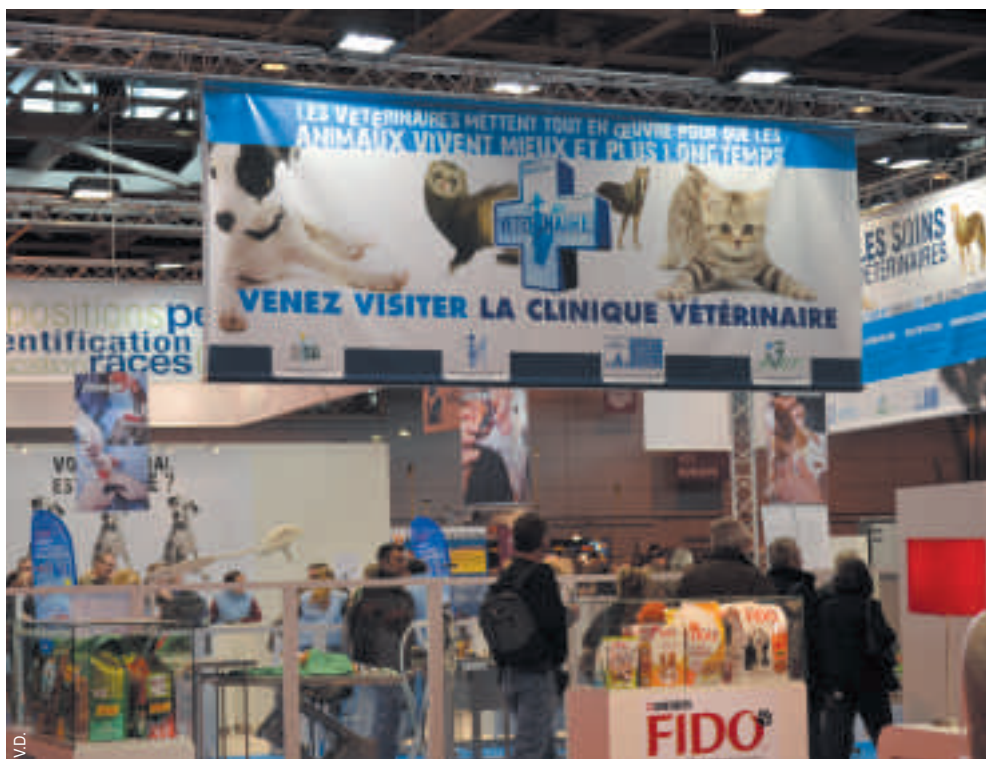
▲ Les visiteurs ont assisté à des consultations et découvert le matériel utilisé par les praticiens dans la clinique vétérinaire reconstituée sur le stand SNVEL-Avef-Afvac-Gipsa.