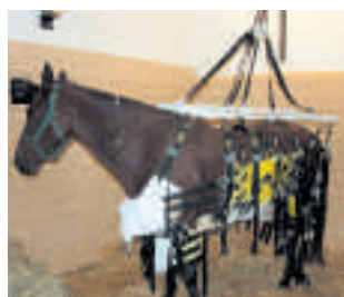
La Dépêche Vétérinaire

Gestion de l'animal traumatisé : respecter la procédure P 12