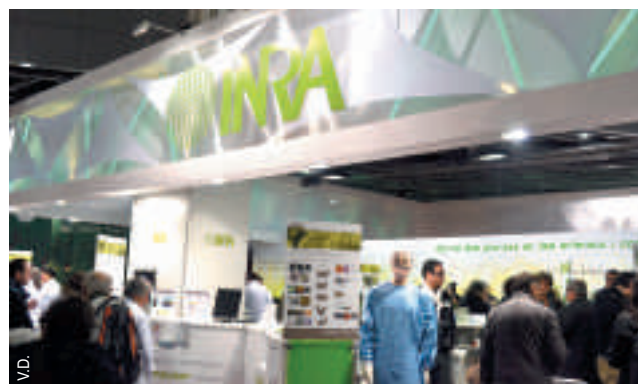
▲ En dehors du Parcours vétérinaires des vétérinaires étaient également présents sur les stands de l'Inra et du Cirad. ▼