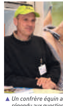
▲ Un confrère équin a répondu aux questions des visiteurs sur le stand commun SNVEL Avef-Afvac-Gipsa.